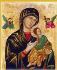
Ntra. Sra. del Perpetuo Socorro Patrona de las misiones redentoristas

Su ámbito de trabajo es preferentemente el parroquial (rural y urbano) y también otros campos pastorales como el cofrade.